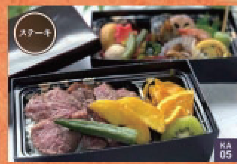
かえて | 3,000円 KA 05

伝承される和のこころ。粋を尽くした繊細で優雅なお料理。日常の雑踏を忘れるゆるやかな刻と空間をご賞味くださいませ。