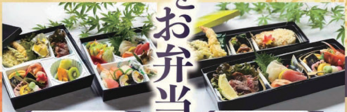
さくら | 5,200円 KA 01