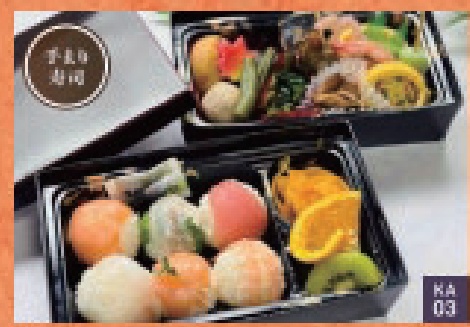
はなみずき | 3,000円 KA 03