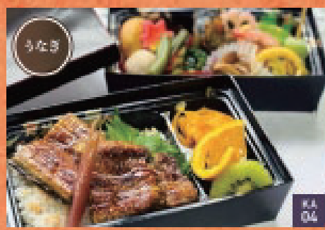
もくれん | 3,000円 KA 04