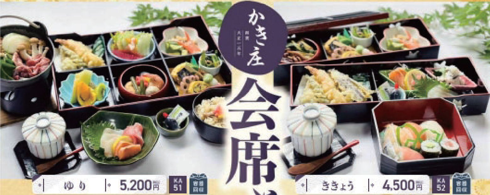
ゆり | 5,200円 KA 51 冷蔵 冷蔵